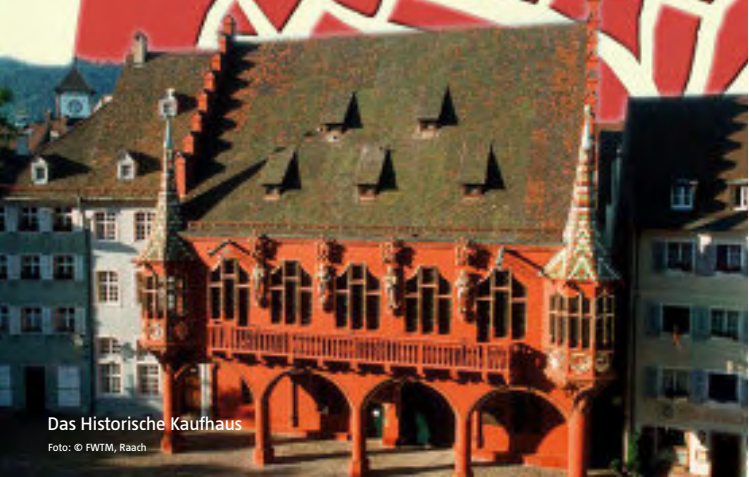
Das Historische Kaufhaus