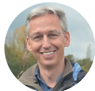
Im Interview mit eco@work : Stefan Leiner, Leiter des Referats Biodiversität bei der Generaldirektion Umwelt der Europäischen Kommission