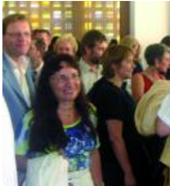
Zum Vortragsabend „Das Öko-Institut im Dialog“ laden die WissenschaftlerInnen am Dienstag, 8. April, ab 18.30 Uhr ins Darmstädter Büro.